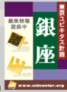
Image of the UC experience using ucodeQR